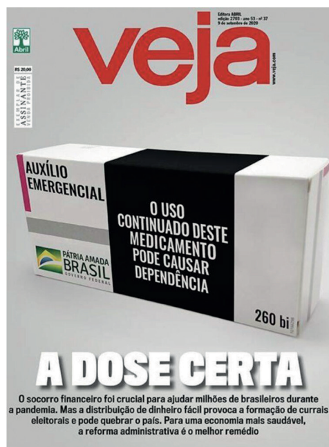
Imagem 2: Capa da revista Veja de 09/09/2020.

Antes de continuarmos com a análise, cabe frisar que Fairclough (2001) aponta que a análise da prática discursiva deve ser orientada por três categorias: a intertextualidade, a coerência e a força do enunciado . Neste texto, vamos nos concentrar nos dois primeiros, já que o terceiro exigiria uma maior explicação sobre a Teoria dos Atos de Fala (ver Fairclough [2001], principalmente o capítulo 3 e Austin [1962]).