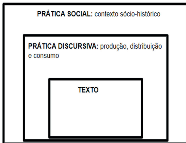
Diagrama 1: A prática discursiva faz a mediação entre prática textual e prática social.

Feitas essas observações, de acordo com Fairclough (2001, p. 103), a análise deve ser iniciada pela prática discursiva , que deve funcionar como um elo entre a prática textual, ou seja, a produção linguística e a prática social, como mostra o diagrama abaixo. A prática discursiva envolve, principalmente, as dinâmicas de produção, consumo e distribuição de um determinado texto . Isso significa examinar quem é o/a autor/a (ou autores/as) do texto, como funciona o processo de sua produção, que responsabilidades sociais estão em jogo, seguindo o modelo proposto por Erving Goffman (1981), diferenciando entre autor/a, animador/a e principal 8 . Nesse sentido, um pronunciamento oficial do presidente da República provavelmente passou por uma equipe de autores/as e revisores/as, enquanto enunciados em uma interação do mesmo presidente com seus apoiadores na porta do Palácio da Alvorada podem ser pensados como uma produção individual, de autoria do próprio presidente.